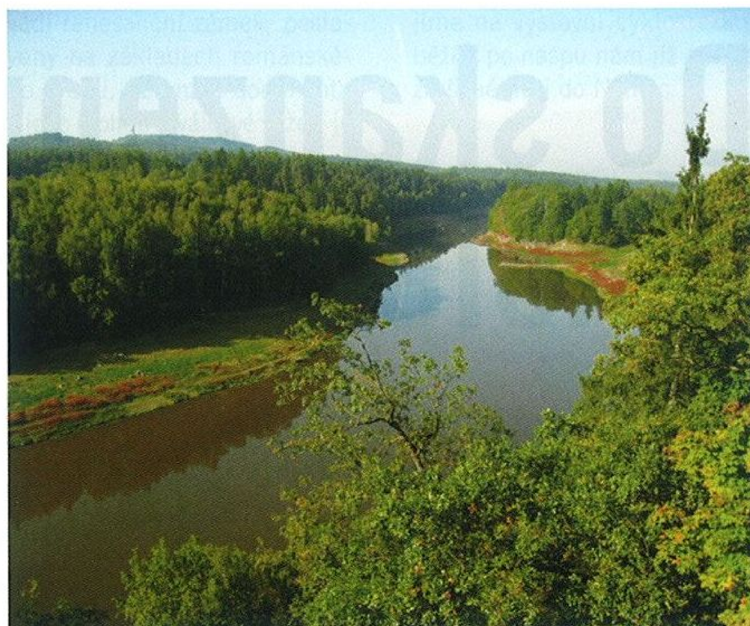
■ Vyhlídka Chebská stráž nabízí úchvatné výhledy na údolí Skalky