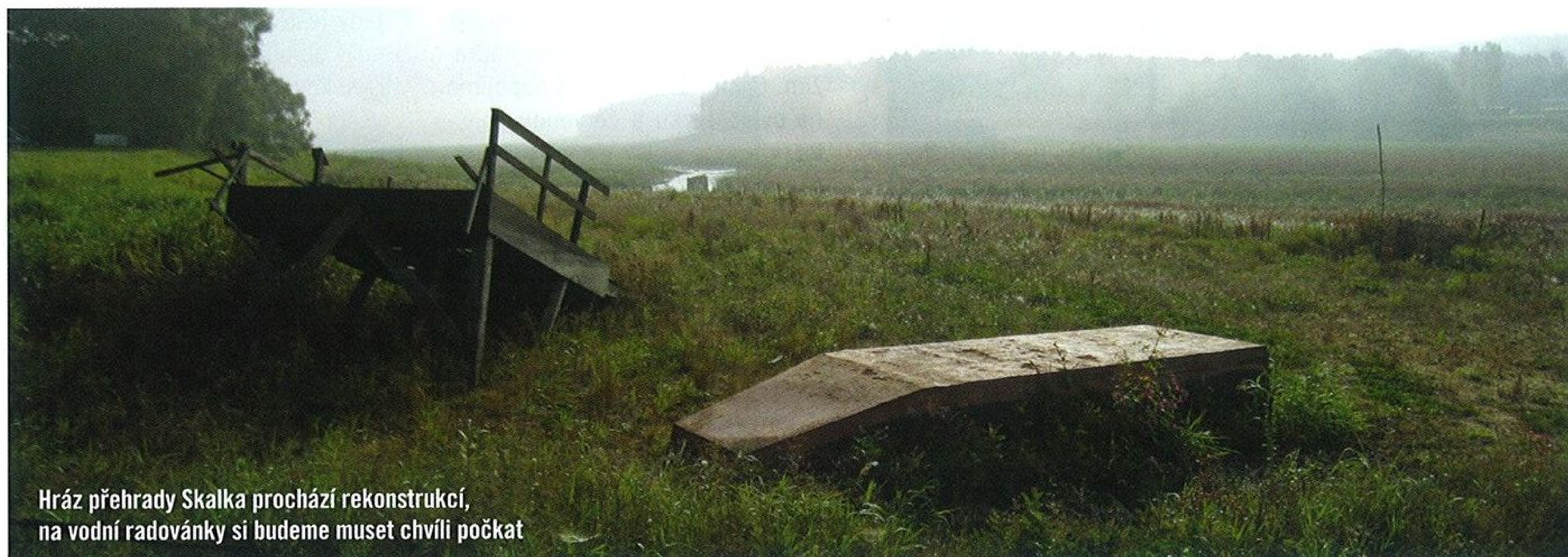
Hráz přehrady Skalka prochází rekonstrukcí, na vodní radovánky si budeme muset chvíli počkat